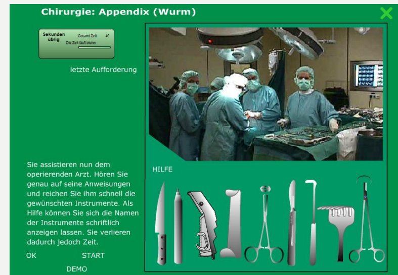
Abb.: Operationssaal in „fachdeutsch medizin“ (DUO)